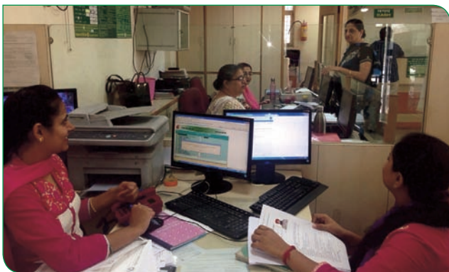
P unjab & Sind Bank takes a progressive step towards women empowerment by setting up some "All Women Branches".

10 पीएसबी ने भारतीय महिला के सशक्तिकरण हेतु प्रगतिशील कदम उठाया है और कुछ शाखाओं को "सभी महिला शाखा" बनाया है।