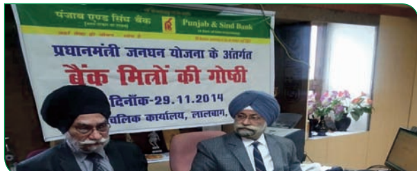
Senior Executives of the Bank having meeting with 'Bank Mitras' at Zonal Office Lucknow.